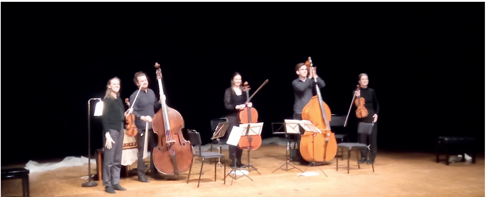
”Vem kan segla förutan vind” på Alandica kultur och kongress den 8 april 2022.