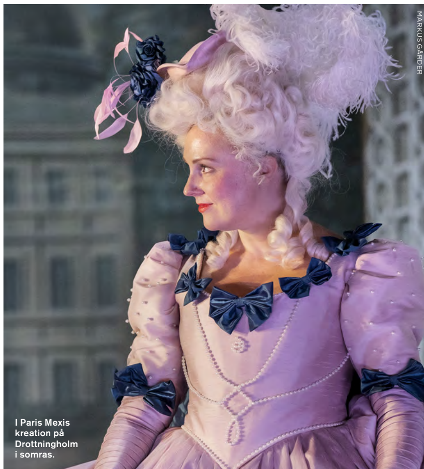
I Paris Mexis kreation på Drottningholm i somras.

»Det behövs ju verkligen nyskrivna operor. Framför allt ur ett jämställdhetsperspektiv.»