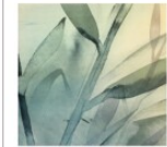
Vass visas i Ulevesund.