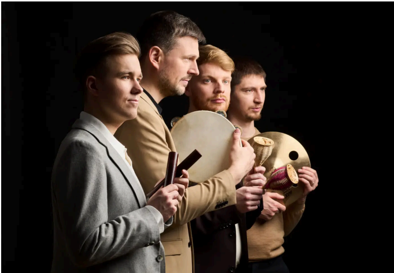
Estonian Percussion Group både spelar och leder en workshop.