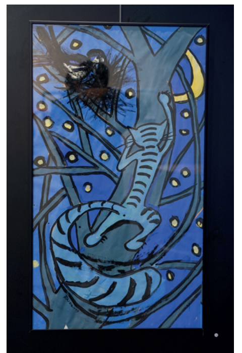
Katt i träd.

–Jag har undervisat i så många skolor och grupper. Det var jätteroligt då jag vikarierade i bildkonst på högstadiet under många år, varje gång såg jag en massa bra bilder som eleverna skapade, även om inte alla var lika bra förstås. Det