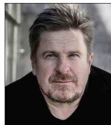
Tysksländske tonsättare Steingrímur Rohloff.

– Vi har själva diskuterat vad det är som gör att man kan höra att ett stycke komponerats av en viss tonsättare som Mozart till exempel, säger Cecilia Ziliacus som