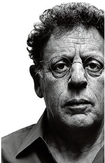
Philip Glass (född 1937) räknas till den amerikanska minimalismens förgrundsgestalter.

– Det här har varit mitt pandemi-projekt, säger den åländske pianisten.