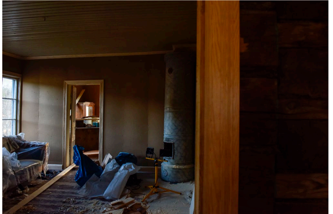
Nästan varje rum i huset har en kakelugn.