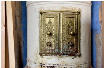
En av de sju kakelugnarna som kommer fungera som husets värmekällor.