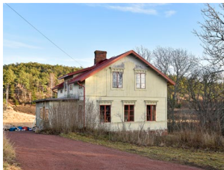
Den gamla mangårdsbyggnaden i Lumpo renoverades senast 1955.

– Saker får ta tid, det är den nya trenden.