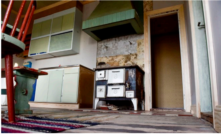
Varje rum har ett färgtema. I köket kommer den gröna färgen bevaras.