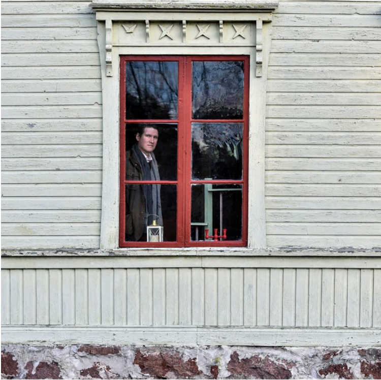
Fasaden kommer få sig ett lager målfärg och kommer bli något gulare än den nuvarande färgen.

Epost: nyheter@alandstidningen.ax Tipstelefon dygnet runt: 15000