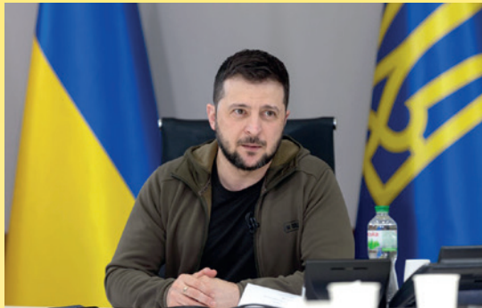
Ukrainas president Volodymyr Zelenskyy.

"Kulturföreningen Katrina kände att den här låten med sitt budskap om Fred, Hopp och Gemenskap behöver få höras av ålänningarna. Den är en ljusglimt i dessa tider", skriver man i pressmeddelandet. (ikj)